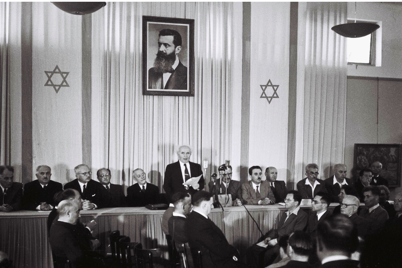
David Ben Gurion ruft den Staat Israel aus. Tel Aviv, 14. Mai 1948 (Israel Ministry of Foreign Affairs: Public Domain).

te die britische Mandatsmacht die Einwanderung von Jüdinnen:Juden so stark, dass vielen Geflüchteten die Einreise verwehrt wurde und sie nur dank Hilfe zur illegalen Einwanderung ins Land gelangen konnten. Nach dem Zweiten Weltkrieg sahen Überlebende der Shoah das Mandatsgebiet vielfach als einzigen Ausweg. Der Konflikt im Mandatsgebiet eskalierte währenddessen so weit, dass ab 1947 eine bürgerkriegsähnliche Situation entstand. Die britische Mandatsmacht kündigte daraufhin an, das Gebiet zu verlassen und die Verantwortung an die neu gegründeten Vereinten Nationen zu übergeben (vgl. Brenner 2016: 113).