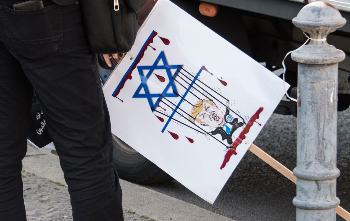
Berlin, 1. Juni 2019, „Al-Quds-Marsch“.

ihre gesellschaftliche Schlechterstellung, ihre Ausbeutung und Gewalt zu legitimieren. Im Antisemitismus findet neben einer Abwertung auch eine Überhöhung der Fremdgruppe statt. Jüdinnen:Juden werden als mächtig, einflussreich und wohlhabend dargestellt, was dazu führt, dass sie als über- oder allmächtig und somit als unbändige Gefahr für die eigene Gruppe wahrgenommen werden. Jüdinnen:Juden werden jedoch nicht nur als Fremde, sondern als die grundsätzlich Anderen, als Gegenentwurf beziehungsweise als Feinde der Menschheit gesehen [1]. Grundlegende Dimension des Antisemitismus ist daher die Vernichtung der Juden [2], die als Selbstverteidigung imaginiert wird.