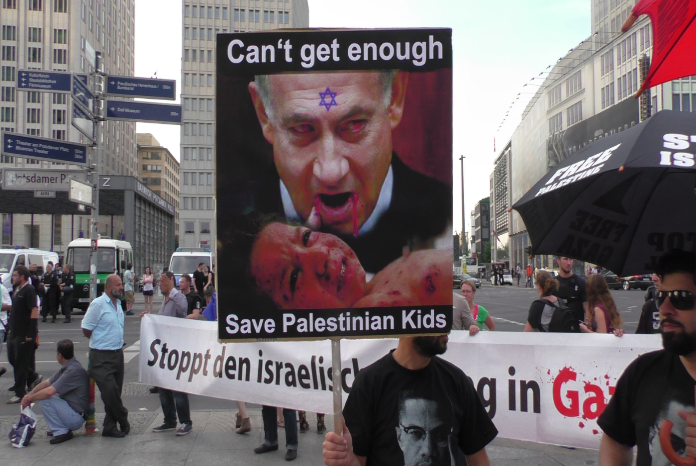
Berlin, 26. Juli 2014, „Für Frieden in Gaza Sternmarsch“.

In dem Spruch „Kindermörder Israel“ werden beispielsweise Vorstellungen aus den Ritual- und Kindermordlegenden aus dem Mittelalter reaktiviert. In der Darstellung des Premierministers Netanjahus als blutrünstiger Teufel wird dieser in Tradition der Gottesmordlegende als teuflisch und gottverlassen dämonisiert. Auch entmenslichende Metaphern wie die Bezeichnung Israels als „Pest“ oder „Krebsgeschwür“ tragen zur Feindbildkonstruktion bei. Doch nicht immer sind die antisemitischen Zuschreibungen so offensichtlich. Sie werden häufig durch Chiffren oder Codes verschleiert. Indem der Zionismus von einem Unabhängigkeitsstreben eines verfolgten Volkes in ein imperialistisches Herrschaftsstreben umgedeutet wird, wird die antisemitische Vorstellung des jüdischen Allmachtstrebens aufgegriffen. Durch die Beschreibung Israels als Kolonialmacht oder die Gleichsetzung