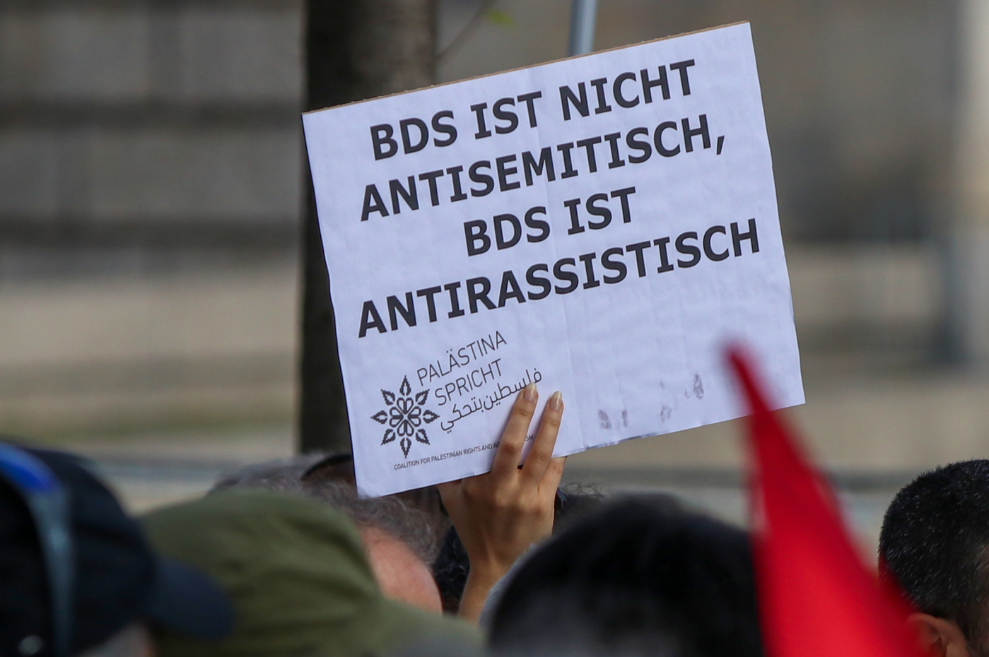
Berlin, 28. Juni 2019, Kundgebung gegen den BDS-Beschluss des Bundestages.