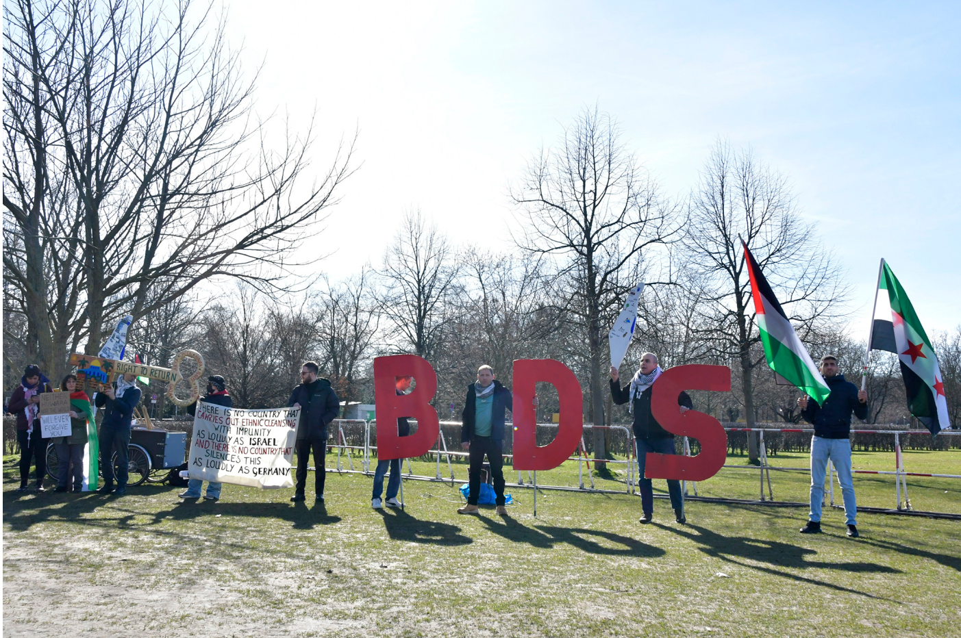
Berlin, 16. März 2023, im Anschluss an die „Netanjahu not Welcome“ Kundgebung.

großer christlicher Konfessionen [3] sowie in globalisierungskritischen Milieus finden sich Sympathisant:innen von BDS. Israelkritische Aktivist:innen agieren hierzulande vorsichtiger als anderswo. Bis heute gibt es in Deutschland eine gewisse Zurückhaltung gegenüber BDS – Analogien zur NS-Parole „Kauft nicht bei Juden“ hemmen die israelfeindliche Boykott-Lust. Teilweise gesellschaftliche Rückendeckung erhalten BDS-Aktivist:innen vor allem im Kultursektor. Um Assoziationen an den Boykott jüdischer Geschäfte am 1. April 1933 zu vermeiden, ist heute unterhalb der BDS-Schwelle kaum mehr das hässliche Wort „Boykott“ zu hören.