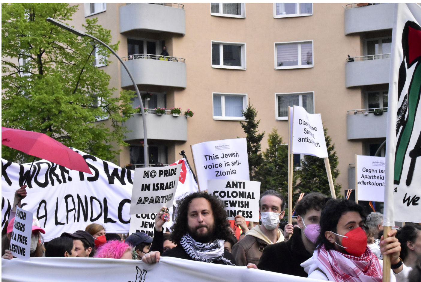
Berlin, 1. Mai 2022, „Revolutionäre 1. Mai Demonstration“.

2023 zeigte sich das in einem Interview auf marx21.de , das sich mit den Demonstrationsverboten im Jahr 2022 befasst. Darin betont eine Aktivistin der #Nakba75-Kampagne: „Palästinenser:innen werden dem Generalverdacht des Antisemitismus und der Gewalttätigkeit ausgesetzt. Dabei traf das Verbot ebenso die ‚Jüdische Stimme für gerechten Frieden in Nahost‘.“ ( marx21 2023 ) Die Aktivistin suggeriert, dass die Proteste gar nicht antisemitisch hätten sein können, weil auch die Jüdische Stimme beteiligt war. Doch dieser Annahme liegt ein Irrtum zugrunde: Auch Jüdinnen:Juden können antisemitisch denken und handeln.