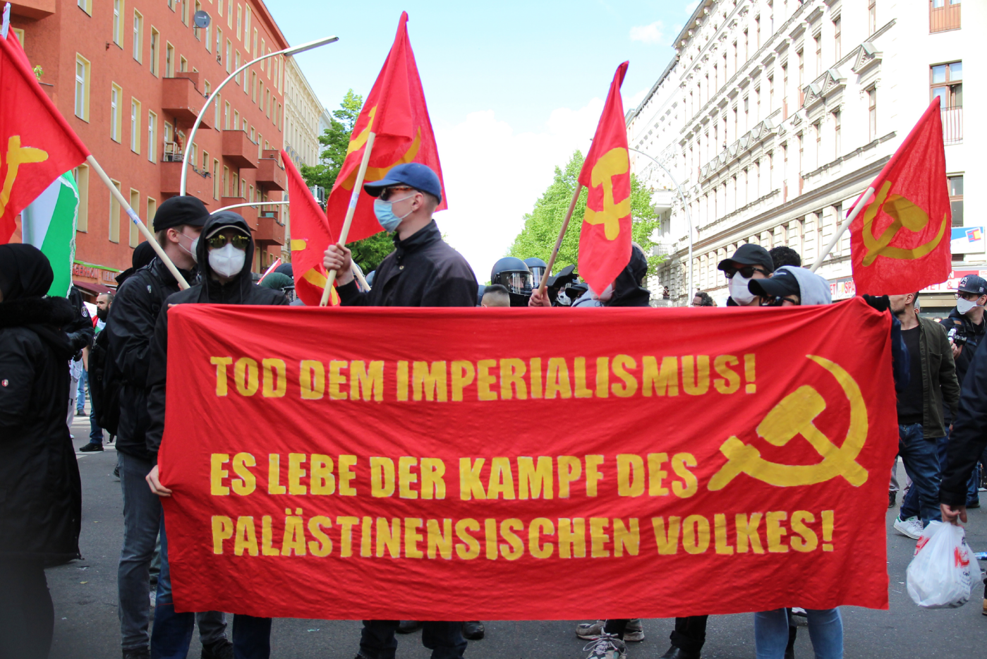
Berlin, 15. Juni 2021, Demonstration anlässlich des Nakba-Tages.

pitalinteressen rauben wolle. Dies führt zu der Überzeugung, Israel sei ein illegitimer Kolonialstaat und der Zionismus ein dementsprechendes Projekt. Gleichzeitig werden die Adressat:innen der Solidarität durch Homogenisierung als per se gut dargestellt und ihrer menschlichen Individualität und Handlungsmacht beraubt. Die israelische Armee, die sich gegen palästinensischen Terrorismus verteidigt, wird zum Feind eines unterdrückten und um Befreiung kämpfenden Volkes stilisiert, ohne dass auf die realpolitischen und historischen Bedingungen des Konflikts eingegangen wird.