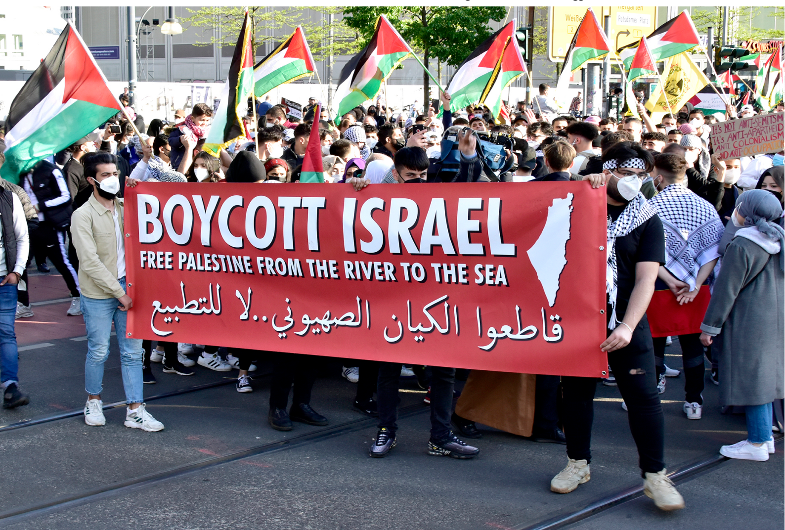
Berlin, 19. Mai 2021, „Gegen die israelische Aggression in Palästina“.