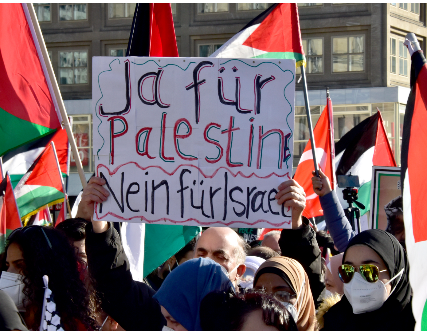
Berlin, 19. Mai 2021, Demonstration im Rahmen des Israel-Gaza-Konflikts 2021.