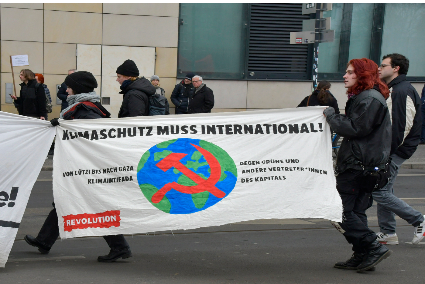
Berlin, 3. März 2023, Globaler Klimastreik.

maintifada“ hervorgebracht. Durch diese Parolen werden irreführende Verbindungen zum bewaffneten Kampf gegen Israel gezogen. In Anbetracht der Tatsache, dass der Täter von Hanau in seinem Manifest die Auslöschung der israelischen Bevölkerung fordert, ist dies besonders perfide.