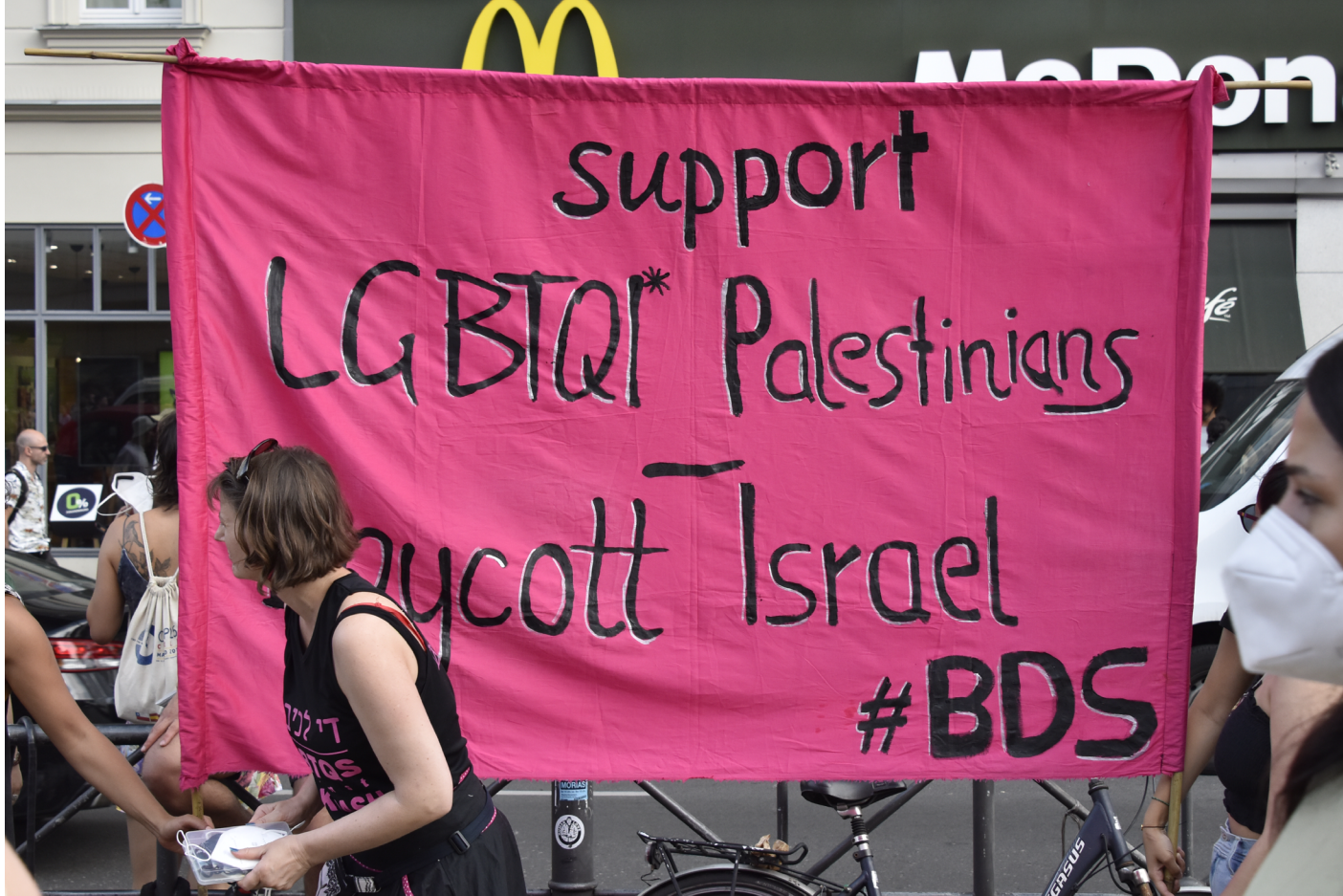
Berlin, 24. Juli 2021 „Internationalist Queer Pride“.